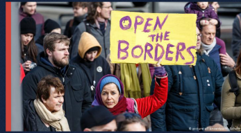
M. SCHOLZ, DPA, 7 MART

Yunanistan Başbakanı Mitsotakis: "Mültecilere yapılan her türlü mali yardımlar kesilecek. Mülteciler kendi hayatlarını kazanmaları için bundan böyle kendilerine bir iş bulmalıdır." (BBC Türkçe)