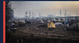
15 MART

Cumhurbaşkanı Erdoğan: "Yunanistan sınır hattında takındığı tavrın cinayet olduğunu bilmeli, bunların hesabını soracağız." 10 MART