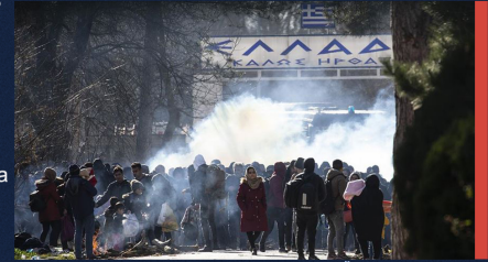
GÖKHAN BALCI, AA, 3 MART

Birleşmiş Milletler Yargısız ve Keyfi İnfazlar Özel Raportörü Agnes Callamard: "Kadın ve çocuklara ateş açılıyor, botları açık denizlere itiliyor. Burası Nazilerden kaçan, mültecilere ateş açılan 1940'ların Avrupa'sı değil, 2020'nin Avrupa'sı" (Euronews)